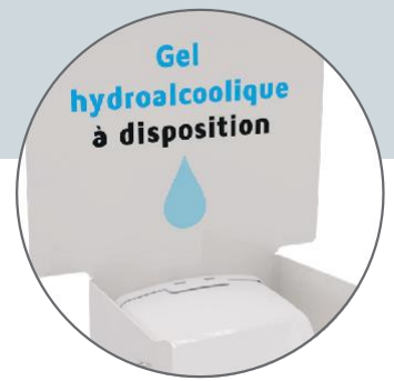
Plaque signalétique neutre (personnalisable)