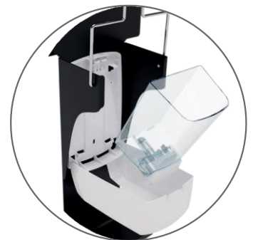
Réservoir transparent Pompe anti-gouttes