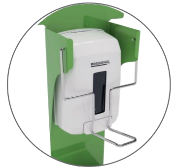
Barre de pression qualité premium